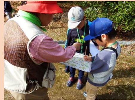
インタプリターとともに探します。

午後は、森のなかには何があるのか探して、もりの学舎に来る人にわかるようにしようと地図にのせる情報を集めにいきました。